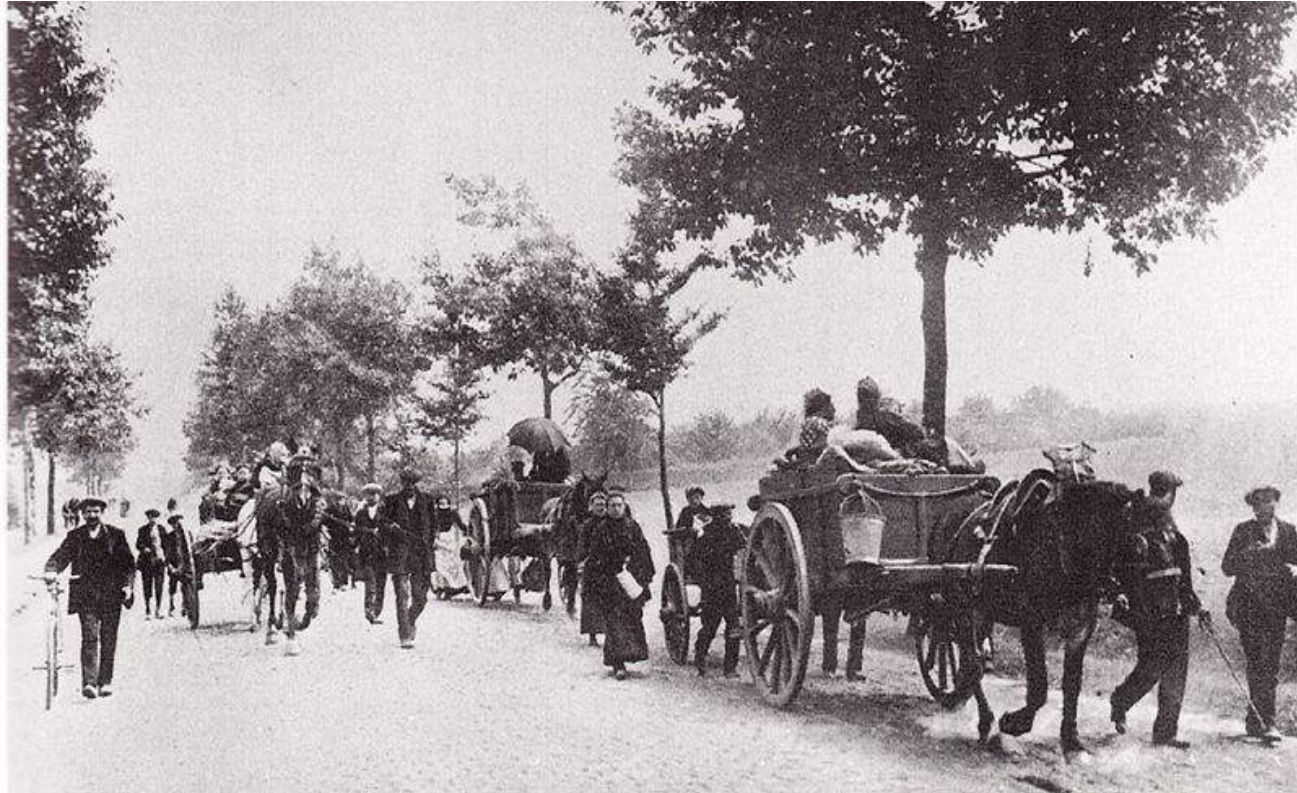
Exode de familles française en 1914...